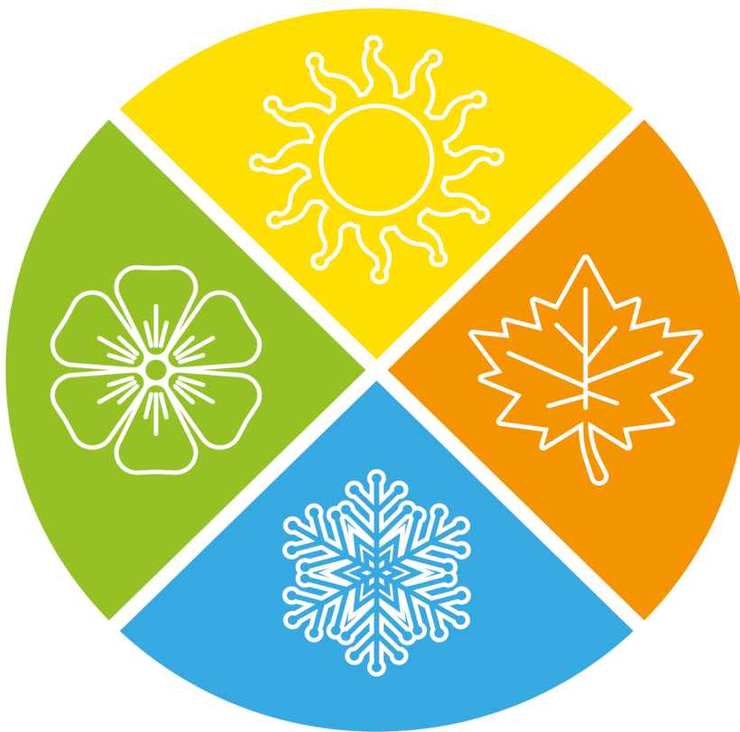
Wzór planszy z porami roku

Uczniowie otrzymują zbiór obrazków wielu warzyw i owoców oraz planszę z porami roku (albo z wybranym miesiącem) i na odpowiednich polach (albo na planszy miesiąca) umieszczają warzywa i owoce typowe dla danego sezonu (miesiąca).